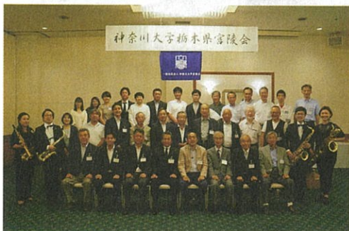
神奈川大学栃木県宮陵会

会員は一人の卒業生を同行する、との会長の言葉とともに皆様がお元気で澁刺とされていたことが印象に残っている。