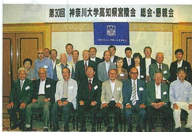
第30回 神奈川大学高知県宮陵会 総会・懇親会

①会員数に比し、総会出席者が少ない（10人に1人）。他県の地域組織と同様に、参加人数を増やす方法はいかに？ ②会員同士が知り合い、助け合い、団結できる催し物は何が良いい？ ③神奈川大学への入試志願者を、もっと増やすことはできないか（試みに、一昨年度の高知県からの志願者は40人。四国全体で240人。合格者は56人。かつて神奈川大学は授業料が安く、地方出身者が多かった） ④母校・神奈川大学および宮陵会が地元でもっと周知され愛されるように、県内の各会員や篤志家（OB・OG）の寄付によって、優秀な出身学生に奨学金を給付する制度を、県の地域組織単位で創設することはできないだろうか等々。