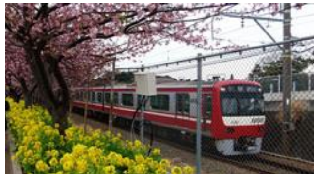
三浦海岸の河津桜と菜の花 2020.2

新型コロナウイルスの感染が国内外で拡大している。大切なのは基本的な予防対策に努めつつ、正しい情報に基づき、適切な行動を取ることに。いつか起きるかわからない時代。だからこそ、支え励まし合う、心のつながりを強めていきたい。その一助となれば。(塩塚定雄)