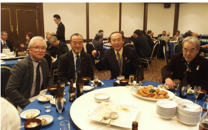
▲左から大倉・古川・石渡・落の各氏