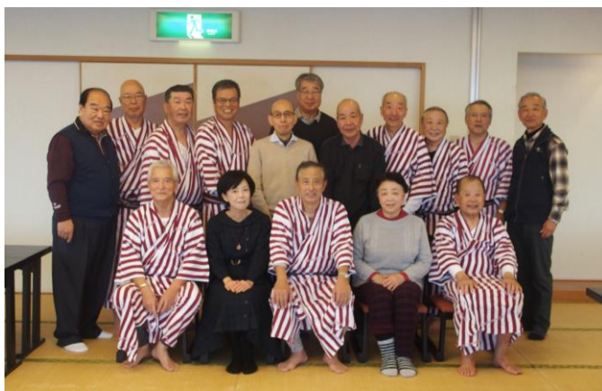
三浦半島宮陵会役員 (京急城ヶ島ホテルにて)

役員会終了後は、日帰り温泉に入浴し忘年会を開催。海の幸を堪能し、カラオケで最高に盛り上がりました。