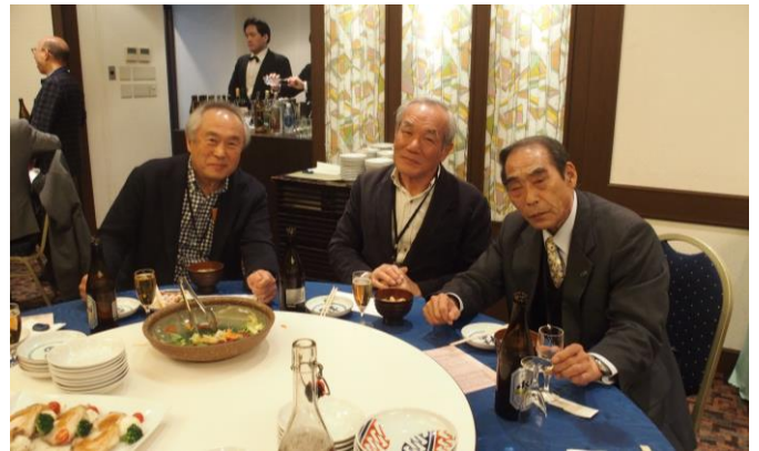
▲左から古敷谷・稲垣・霧田の各氏