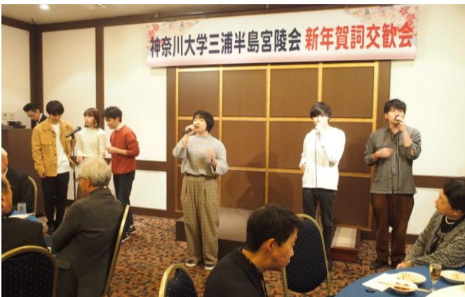
▲神奈川大学アカペラサークル「JACK」の6人組