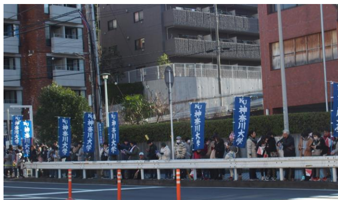
JR保土ヶ谷駅前に立ち並ぶ神大の幟 2020.1.2