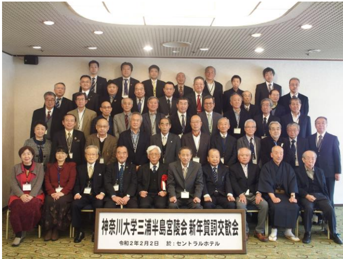
新年会参加者〔セントラルホテルにて〕