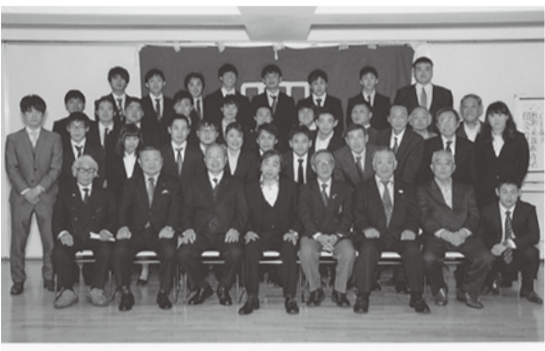
神奈川大学柔道部納会 於 ラックスホール 平成29年12月2日